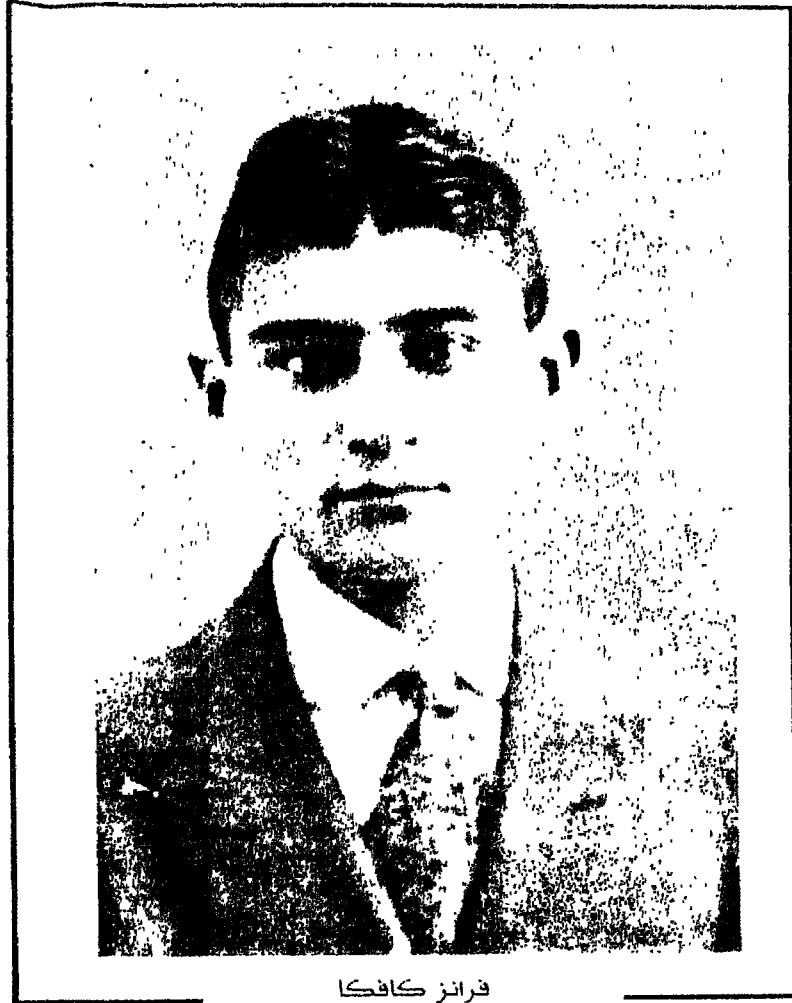
فرانز كافكا الموظف